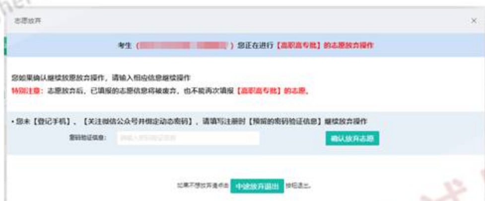
图 19 密码验证信息

验证通过后，放弃操作成功，考生将不能再填报当前该批志愿。同时，系统会给考生发送放弃志愿的只读邮件提醒。