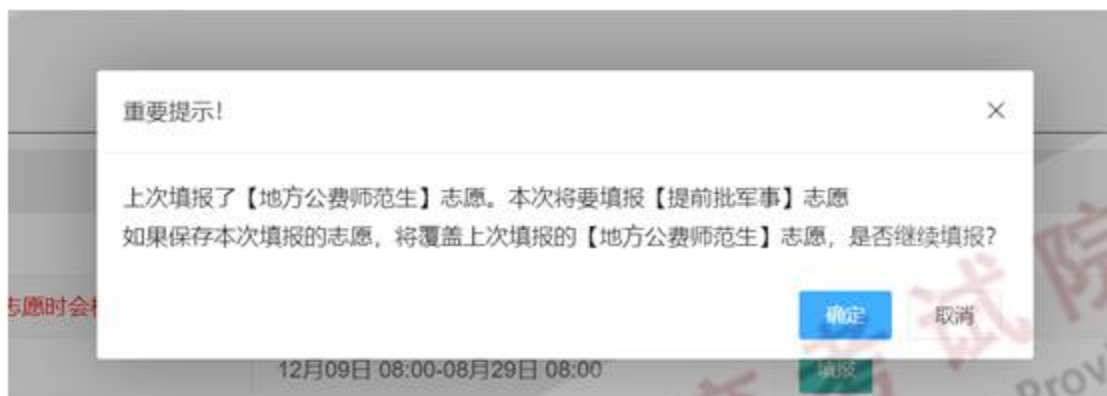
图 12-2 更改提前批次志愿保存提示信息

2、考生在填报本科提前批志愿时，从体育、艺术提前批、军队、公安、司法院校、地方公费师范生以及有特殊要求的高校中，只能选报其中一类，不得兼报。专科提前批包括艺术、体育、定向培养士、空乘、航海、医学、师范等有特殊要求的专业类别，各类别不得兼报。志愿填报总共有 3 次保存机会，如果考生改报其他类别的志愿，系统会在右侧提示考生上一次填报的批次名称。