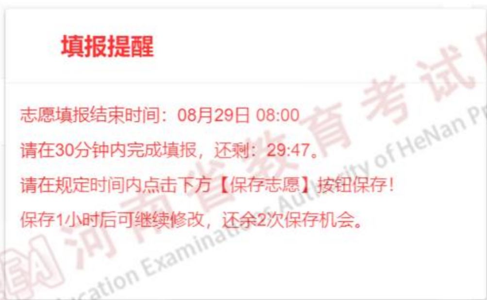
图 10 倒计时提醒

5、根据招生计划信息，输入院校代号和专业代号，院校和专业信息填写完整后，若有专业调剂选项，请选择是否同意专业调剂。