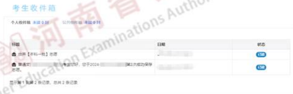
图 20 放弃志愿只读邮件列表

验证通过后，放弃操作成功，考生将不能再填报当前该批志愿。同时，系统会给考生发送放弃志愿的只读邮件提醒。