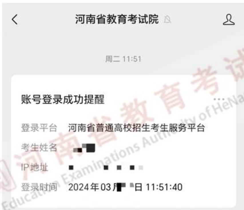
图 27-1 成功登录考生服务平台微信提醒