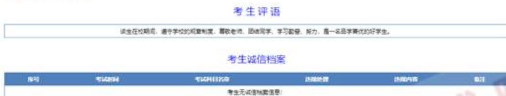
图 29 考生评价信息