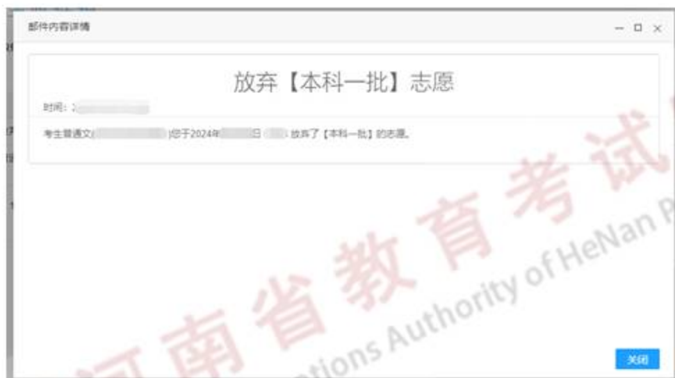
图 21 放弃志愿只读邮件

在当次志愿填报时间截止前，考生可以随时进行放弃填报志愿操作，但要慎重，填报同一组内不同类别的志愿时会相互覆盖，放弃其中一类时本组志愿全部放弃（图 22）。一旦放弃，考生将不能再次填报当次该批次志愿（ 考生只是想修改志愿时，切勿进行放弃操作 ）。如果网上无法操作，考生可以持准考证原件和身份证原件到报名所在地教育招生考试机构进行放弃操作。