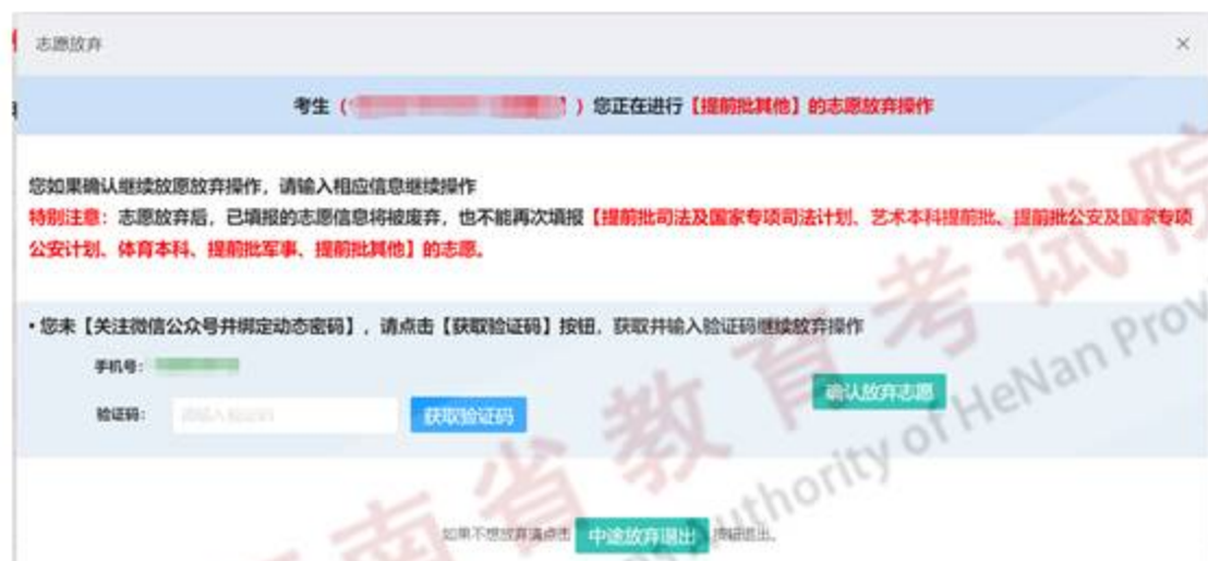
图 18 手机验证码有效期 5 分钟