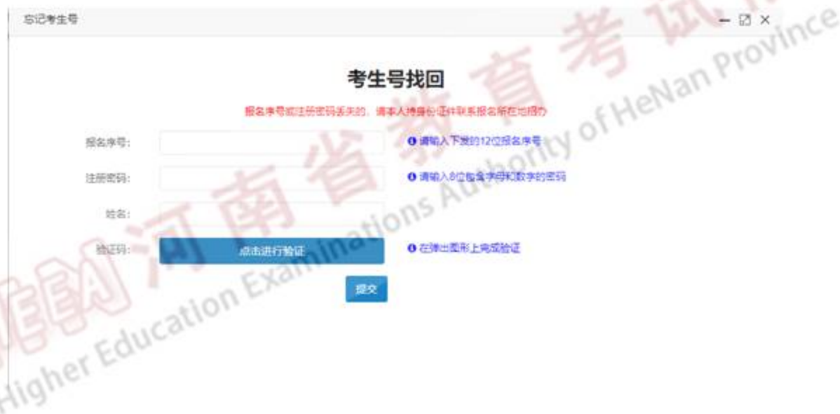
图 6-1 找回考生号

已注册过的考生,如忘记考生号或者密码,可以通过菜单栏的“忘记考生号”、“忘记密码”菜单项找回自己的考生号以及重置登录密码(如图 6-1 和图 6-2)。无法重置密码的,考生本人持准考证原件和身份证原件到报名所在地的市县教育招生考试机构重置。