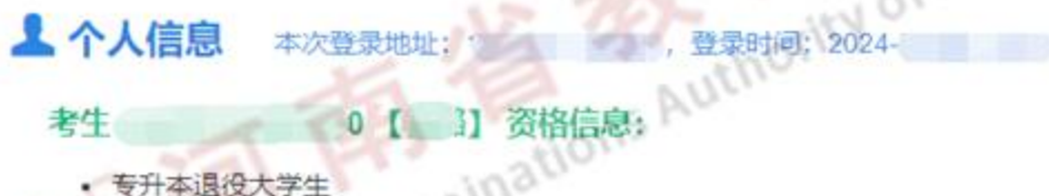
图 28 相关信息查看