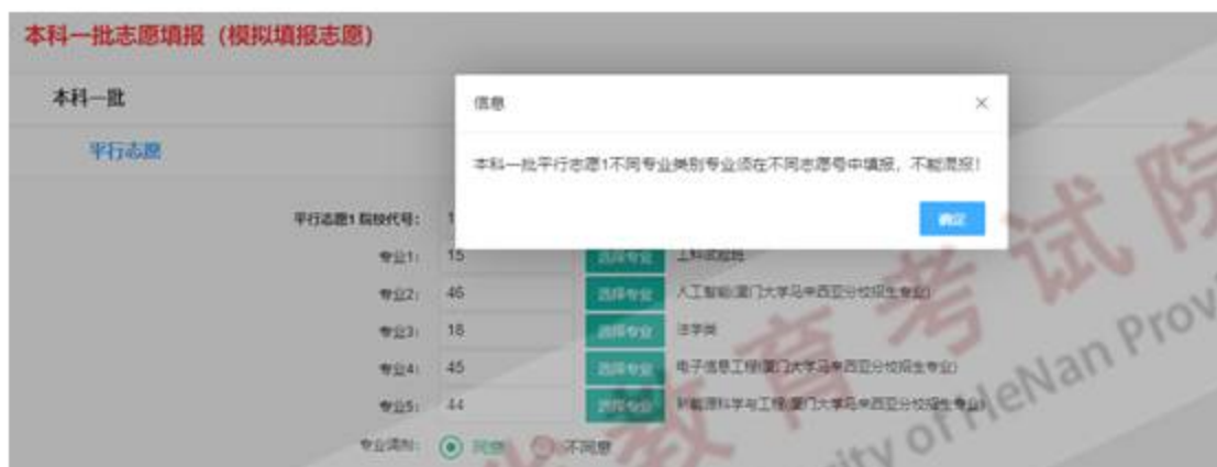
图 12-1 专业填写错误提示

2、考生在填报本科提前批志愿时，从体育、艺术提前批、军队、公安、司法院校、地方公费师范生以及有特殊要求的高校中，只能选报其中一类，不得兼报。专科提前批包括艺术、体育、定向培养士、空乘、航海、医学、师范等有特殊要求的专业类别，各类别不得兼报。志愿填报总共有 3 次保存机会，如果考生改报其他类别的志愿，系统会在右侧提示考生上一次填报的批次名称。